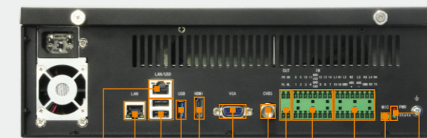
LAN LAN USB3.0 VGA CVBS DI DO MIC 1x PWR LED 2x USB2.0 HDMI AMP RS485 1x SATA LED